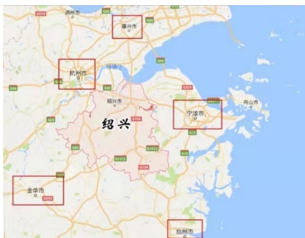
Figure 1. The location of Shaoxing.

官方标牌和私人标牌反映了不同群体和组织在城市语言景观中的地位和作用。官方标牌强调公共利益、国家核心价值观，在城市规划与管理中承担