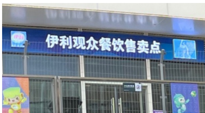
Figure 3. Commercial slogans.