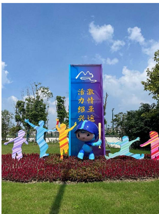
Figure 4. Event promotional slogans.