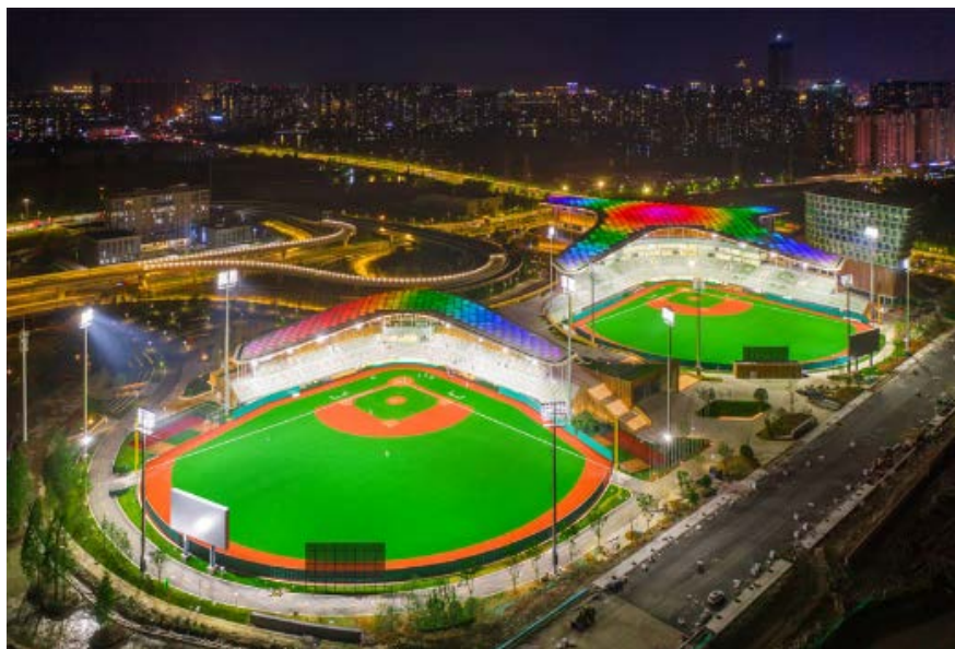
Figure 2. Shaoxing baseball and softball sports cultural center.