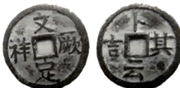
Figure 2. Coins with characters regarding six ceremonies of betrothal and marriage.

在周代，就已经确定了“嘉礼之别有六”的形式，并对后世产生深远影响。陈顾远指出：虽其细节不特因时而异，抑且因地而别，但若依大体而论，究莫离乎《昏义》所谓纳采、问名、纳吉、纳征、请期、亲迎与夫盥馈或奠菜之范围也[6]。如图2所示，这是两枚铜币印有婚姻六礼之二，左边的文字为“文定厥祥”，右边的为“卜云其吉”，这两个铜币体现了六礼中纳吉和纳征的仪式。