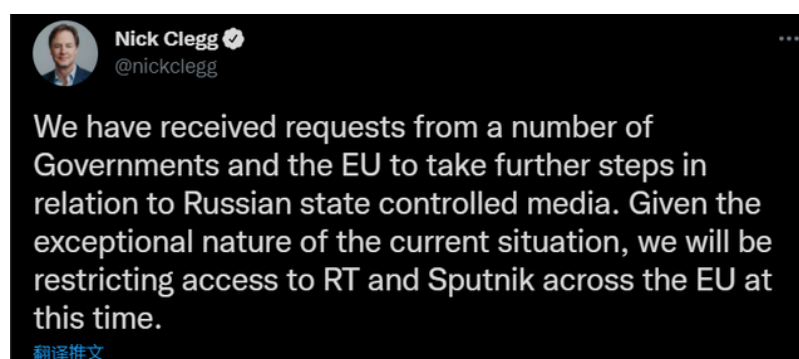
图 2. Facebook 母公司 Meta CEO 在 Twitter 上表示暂时限制整个欧盟看到俄罗斯新闻频道 RT 和 Sputnik