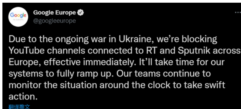
图 3. YouTube 在欧盟各地屏蔽了俄罗斯新闻频道 RT 和 Sputnik

战争中的立场，即帮助乌克兰战胜俄罗斯，从而使乌克兰加入北约，从地缘政治角度，扩大北约的力量，稳固其世界霸主的地位。二战后，美国为了遏制苏联，维护其在欧洲的主导地位，联合西欧一些国家于 1949 年 4 月 4 日正式成立了北约，苏联解体后，北约承诺绝不会向东扩张，哪怕是一英寸。而实际上，从 1990 年到 2020 年，北约已经进行了 5 次东扩。这次俄乌冲突，本质上也是乌克兰想加入北约，而这已经触及到了俄罗斯的底线。