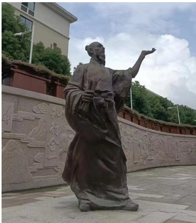
图 1. 校园雕塑