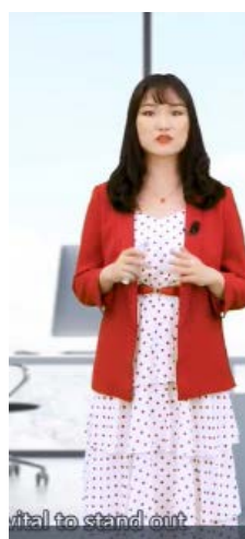
图 3. 真人主讲教师形象

图像的颜色是揭示情态的重要特征[23]，整体来说外语微课的色度偏低，色调偏浅，颜色单一，这与外语微课以语言教学为目标有关(表 6)。在标题、