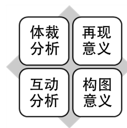
图 1. 微课多模态话语分析框架

体裁是具有共同交际目的，可辨认的、内部结构特征鲜明的、高度约定俗成的一组交际事件[20]。在体裁分析框架中，语步是执行同一个交际功能的语篇单元，具有较为灵活的语言实现形式，既可以是一句话或一段话，也可以是由几段话组成的篇章[21]。吴婷[16]分析 2014 年第一届外语微课大赛两个一等奖作品总结出外语微课的三个语步特征：引入 - 展开 - 总结。本文在吴婷分析的基础上将微课视频分为七个语步，其中部分是必要语步，部分是可