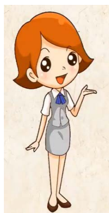
图 2. 卡通主讲教师形象