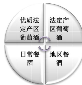
图 2. 意大利酒等级

意大利将酒类严格分为四个等级,分别是:优质法定产区葡萄酒(DOCG)、法定产区葡萄酒(DOC)、地区餐酒(IGT)、日常餐酒(VDT)四大等级(如图 2 所示)。优质法定产区葡萄酒(DOCG)是意大利葡萄酒等级中最高级质量的产品,拥有着公认的一等品质,每一瓶优质法定产区葡萄酒(DOCG)的瓶口均有封印。至 2009 年 5 月,全意大利至少有 38 个产区生产此等级的葡萄酒,那些想获准拥有这一等级葡萄酒的生产商,必须在特定的产区将葡萄酒入瓶,并使其葡萄酒接受农业部蒙瓶试饮评审,通过评审的才能被冠上“优质法定产区葡萄酒”(DOCG)的称号。法定产区葡萄酒(DOC)属于第二等级质量的产品,表示质量受监控的级别,即,用来酿酒的葡萄原料必须符合特定产区核实准许耕种的品种,且生产葡萄与制造葡萄酒的过程都必须符合法定产区葡萄酒(DOC)法的严格规定,唯及如此,产出的葡萄酒才能取得质量认证。在意大利以严格划分生产地域作为葡萄酒的产地所生产出来的“法定产区葡萄酒”(DOC)约有 305 个品种。第三等级的葡萄酒称为“地区餐酒”(IGT),约有 120 个品种。这一等级葡萄酒原料的来源非常广泛,行业对 IGT 酿造过程的监控比 DOC 酒来得宽松。虽然其受欢迎的程度不及前两种,但是我们还是可以在这类酒中找到好酒。日常餐酒(VDT)是普通等级的葡萄酒,对这一等级的葡萄酒成品,行业的习惯做法是不要求标明产地、来源、年份等资料,但生产商需在标签上表明其酒精含量与酒厂数据。