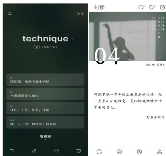
图 3. 极简风格界面 分别摘自句读、不背单词两款 APP。

2) 平台界面的创新。根据调查结果, 大学生对目前市面上的英语教育 APP 界面设计普遍不满意。PURE 简法 APP 侧重于极简化的应用界面设计, 在设计思路, 我们更倾向于向“句读”“不背单词”一类 APP 学习: 一方面, 我们会调整 UI 配色, 用浅色调, 冷色调进行 UI 设计, 降低复杂广告对用户注意力的影响[2]。另一方面, 我们会试图设计更明确易懂的按键, 降低学习者初次使用 PURE 简法 APP 的难度。尝试打造极简风、沉浸式学习环境(如图 3)。